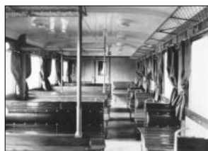
Interiér motorového vozu M232.116