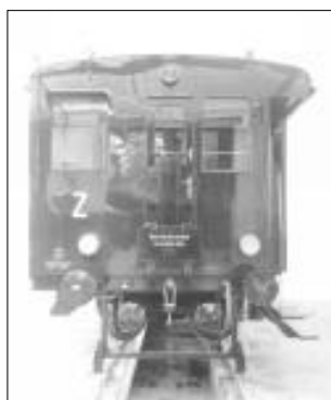
Zadní čelo motorového vozu M232.2