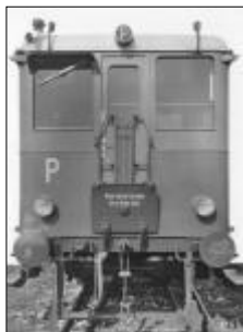
Přední čelo motorového vozu M232.113