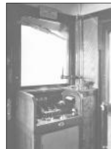
Zadní řídicí pult motorového vozu M232.113

V druhé sérii se skříň vozu prodloužila a rozvor se dále zvětšil na 7 000 mm. Shodný motor Tatra měl zvýšen výkon na 140 k (103 kW) při 1 500 ot/min.