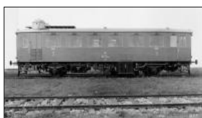
Motorový vůz M232.116 z roku 1935

Úpravu doznala obě čela vozů, která byla zúžena. Počet sedadel pro cestující se zvýšil na 58. Ve snaze o zavádění náhradních paliv v motorové trakci ČSD se do motorového vozu M232.116 zabudovaly dva generátory na dřevoplyn soustavy Vítkovice s příslušenstvím. Motor značky Tatra zůstal ve stejném provedení, při spouštění se používalo benzínu.