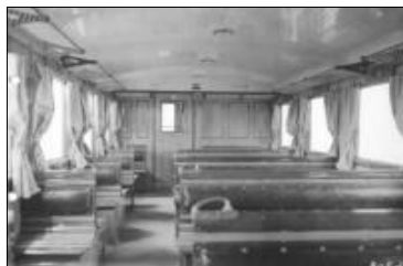
Interiér motorového vozu M232.210