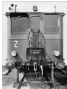
Zadní čelo motorového vozu M232.113