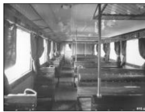
Interiér motorového vozu M232.113