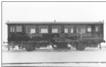
Motorový vůz M232.210 z roku 1933

V roce 1933 nabídla studénská vagonka ČSD nové motorové vozy řad M232.2 s benzínovým a M232.1 s naftovým motorem značky Tatra a elektrickým přenosem výkonu ČKD soustavy RM. První série vozů svými rozměry vycházela z řady M122.0. Rozvor vozu byl však zvětšen na 6 200 mm.