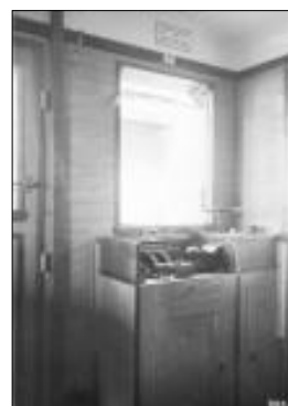
Zadní řídicí pult motorového vozu M232.2