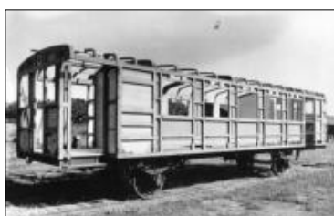
Dřevěná kostra motorového vozu M232.2