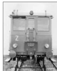
Zadní čelo motorového vozu M232.116