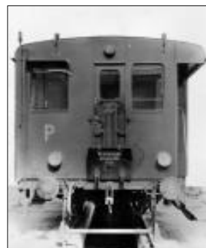
Přední čelo motorového vozu M232.2