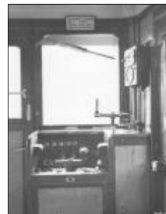
Přední řídicí pult motorového vozu M232.113