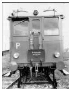
Přední čelo motorového vozu M232.116