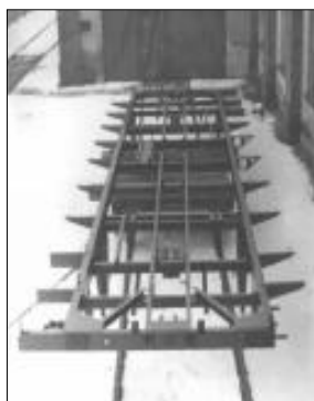
Kostra spodku motorového vozu M232.2

V druhé sérii se skříň vozu prodloužila a rozvor se dále zvětšil na 7 000 mm. Shodný motor Tatra měl zvýšen výkon na 140 k (103 kW) při 1 500 ot/min.