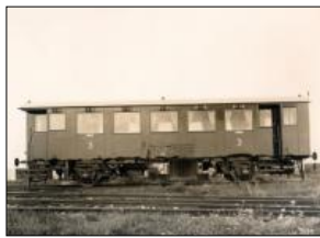
Motorový vůz M232.102 z roku 1934