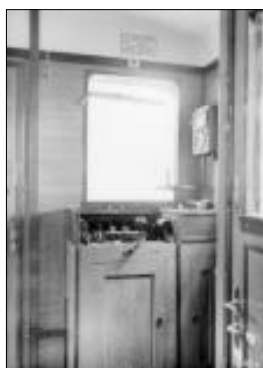
Přední řídicí pult motorového vozu M232.2